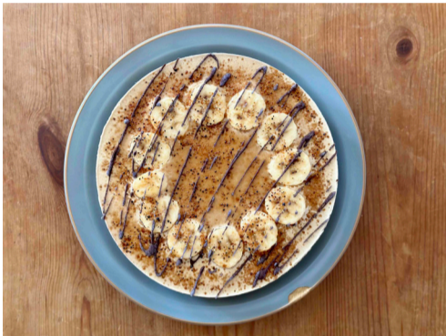
●オーガニックバナナの コーヒーキャラメル Rawケーキ カフェインレス穀物コーヒーと、ドライデーツからできた キャラメル風味のケーキ。有機バナナや スーパーフード入り、しつこくない甘さとコクが特徴です。

——— P.S. by raw sweets ローケーキ 単品 ¥1,080 ——— ドリンク付き ¥1,480