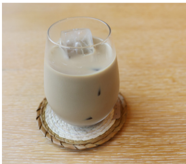
●ソイラテ (HOT/ICE) ¥900