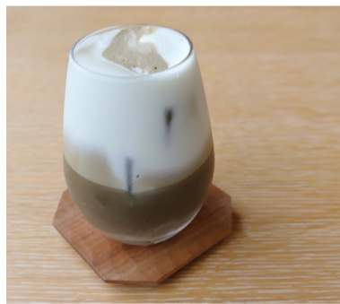
●ソイほうじ茶ラテ ¥900