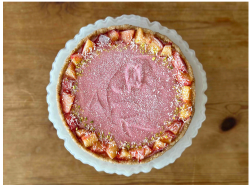
●プラムとチャイの Rawケーキ 小田原産プラムを皮ごと使用、 鮮やかなピンク色の通りに甘酸っぱさが際立つ フィリングと、スパイスを効かせたチャイフィリングを 合わせ、爽やかさも感じられる旬のタルト