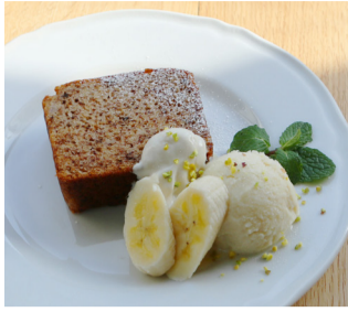
●バナナケーキ ＜アレルギー＞ アーモンド・くるみ・バナナ・大豆 ●アイスバニラ ＜アレルギー＞ カシューナッツ・大豆

——— 本日の日替わりデザート 単品 ¥1,080 ——— ドリンク付き ¥1,480